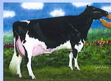
写真:ドナー高祖母 アムラーダ リー アリスET

アブソリュートの母 アムラーダ リー アリスETは 3代EX-94、3代乳器EX、3代指蹄EX