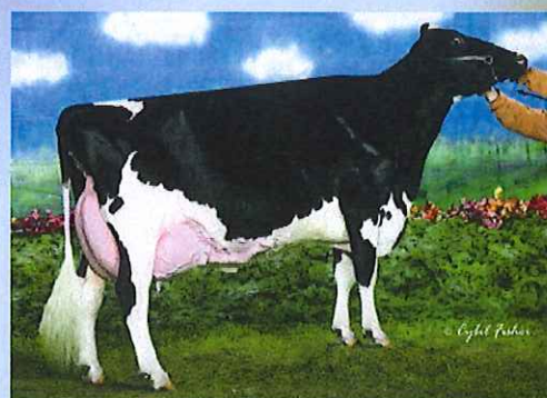
写真:ドナー高祖母 アムラーダ リー アリスET

アブソリュート の母 アムラーダ リー アリスETは 3代EX-94、3代乳器EX、3代指蹄EX