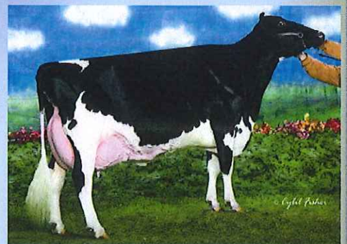
写真:ドナー高祖母 アムラーダ リー アリスET

アブソリュートの母 アムラーダ リー アリスETは 3代EX-94、3代乳器EX、3代指蹄EX