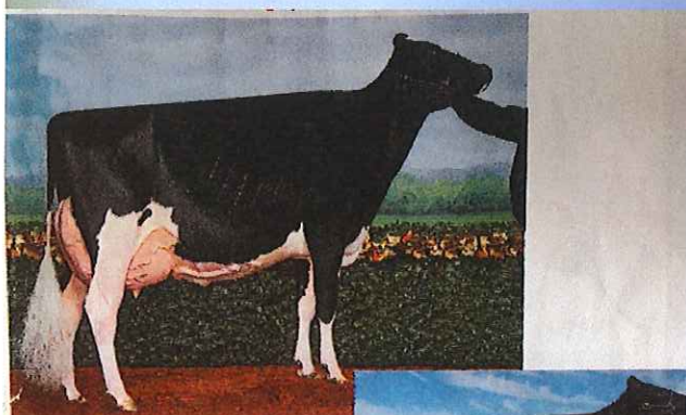
母:ダイナ 4270 EX-95 2017年4オクラス オールアメリカン 2017年4オクラス オールカナディアン 2015年S2オクラス オールアメリカン 2015年S2オクラス オールカナディアン