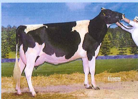
写真 祖々母: ハイロード サンチエス チャーム Ex-92