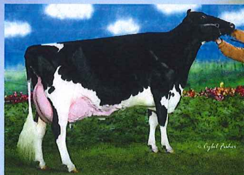
写真:ドナー高祖母 アムラーダ リー アリスET

アブソリュートの母 アムラーダ リー アリスETは 3代EX-94、3代乳器EX、3代指蹄EX