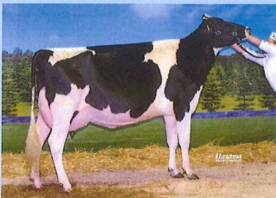
写真 祖々母: ハイロード サンチエス チャーム Ex-92