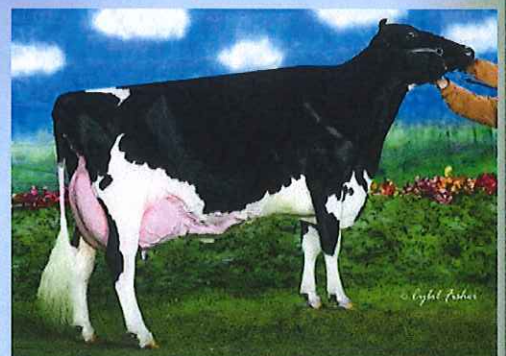
写真:ドナー高祖母 アムラーダ リー アリスET

アブソリュートの母 アムラーダ リー アリスETは 3代EX-94、3代乳器EX、3代指蹄EX