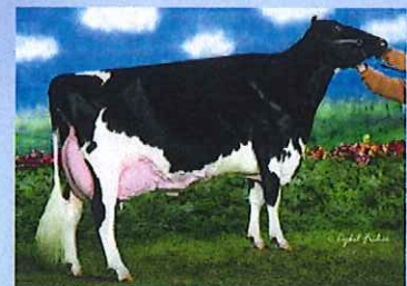
写真:ドナー高祖母 アムラーダ リー アリスET

アブソリュートの母 アムラーダ リー アリスETは 3代EX-94、3代乳器EX、3代指蹄EX