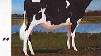
写真: ドナー祖母 コベール デンプシー ダイアナ 4270 ET

母: ダイナ 4270 EX-95 2017年4オクラス オールアメリカン 2017年4オクラス オールカナディアン 2015年S2オクラス オールアメリカン 2015年S2オクラス オールカナディアン