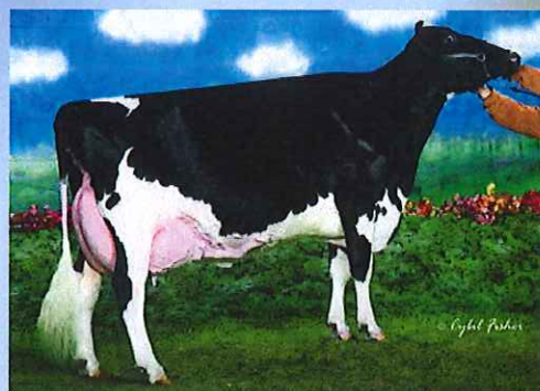
写真:ドナー高祖母 アムラーダ リー アリスET

アブソリュート の母 アムラーダ リー アリスETは 3代EX-94、3代乳器EX、3代指蹄EX