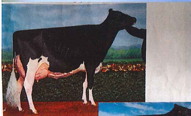
ダイナ 4270 EX-95 2017年4オクラス オールアメリカン 2017年4オクラス オールカナディアン 2015年S2オクラス オールアメリカン 2015年S2オクラス オールカナディアン