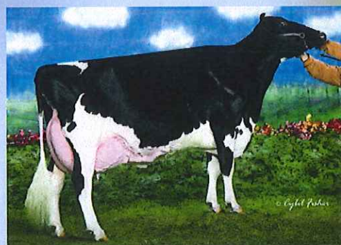
写真:ドナー高祖母 アムラーダ リー アリスET

アブソリュートの母 アムラーダ リー アリスETは 3代EX-94、3代乳器EX、3代指蹄EX