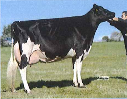
写真: ドナー祖母 ハイロード ダンディー エピソード EX-93